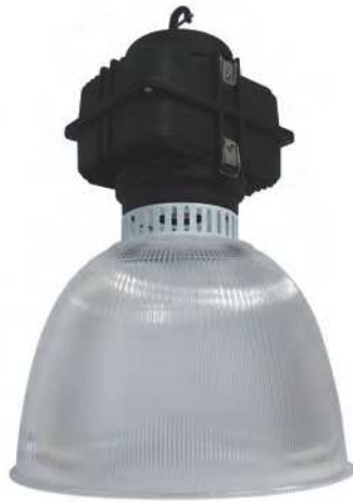
PMMA Reflector Code : 331059