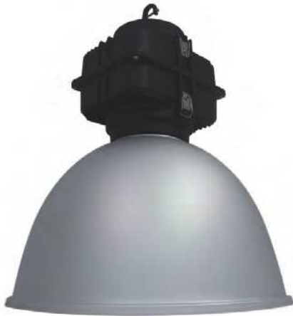
Sand Aluminium Reflector Code : 331057