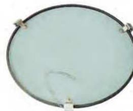
Glass Code : 331061